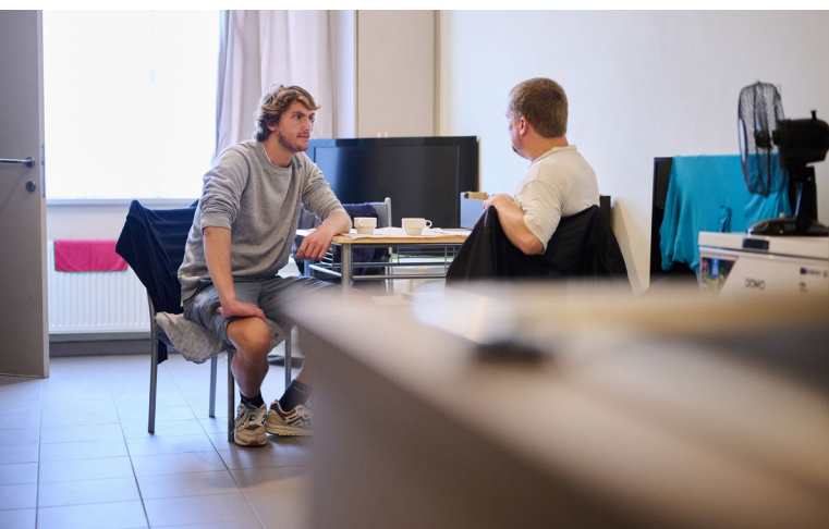
Elke achteruitgang van sociale rechten moet worden gerechtvaardigd en evenredig zijn met de gevolgen ervan voor de betrokken personen

Indien uit dit onderzoek blijkt dat de betrokken rechten worden geschrapt of verlaagd tot onder een minimumdrempel, wordt de maatregel steeds als onevenredig beschouwd. Overheden zijn immers verplicht, bijvoorbeeld, om de uitkeringen te handhaven “op een voldoende niveau, rekening gehouden met de verwachtingen van de begunstigen van het systeem” en dit “zelfs wanneer het als gevolg van de economische situatie (...) voor een Staat onmogelijk is om het stelsel van sociale bescherming te handhaven op het niveau dat het eerder had bereikt”. 51 Volgens het Europees Comité voor Sociale Rechten wordt het Europees Sociaal Handvest geschonden wanneer vervangingsinkomens, zoals uitkeringen wegens arbeidsongeschiktheid, gelijk zijn aan minder dan 50% van het aangepaste mediane inkomen. 52 Een gevoelige vermindering van de vergoeding is ook in strijd met het standstill-beginsel indien ze een impact heeft op de billijke aard van de vergoeding die door de Grondwet wordt gewaarborgd. 53