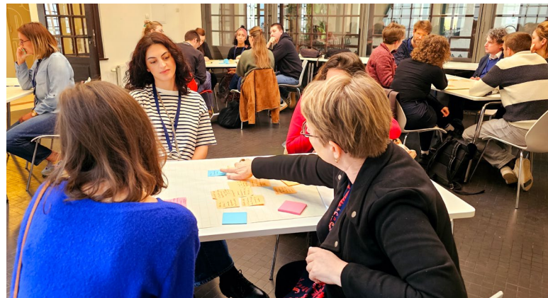
De eerste netwerkdag rond mensenrechteneducatie

De centrale vraag van het evenement luidde: hoe kunnen mensenrechten verankerd worden in het dagelijks leven — op school, op het werk, in het gezin en online? De deelnemers volgden workshops van School for Rights, het Kenniscentrum Kinderrechten (KeKi) en Unia, waarin werkvormen, bestaand leer materiaal en strategieën aan bod kwamen om mensenrechten binnen organisaties te integreren.