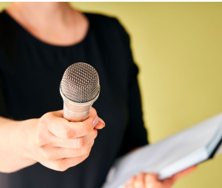
Journalisten, academici en artiesten spelen een belangrijke rol in de maatschappij

Het FIRM onderzoekt de vrijheid en de ruimte die kritische stemmen in België hebben: journalisten, academici en kunstenaars. Deze drie beroepsgroepen analyseren, stellen vragen, informeren en voeden het publieke debat. Ze stimuleren het kritische denken en spelen zo een essentiële rol in een democratische samenleving. Maar ze worden ook geconfronteerd met tal van belemmeringen en uitdagingen, en zelfs met druk. Het FIRM wil daarom hun gevoel van veiligheid, hun ervaringen met inmenging, censuur of intimidatie en hun perceptie van persvrijheid, academische vrijheid en artistieke vrijheid onderzoeken.