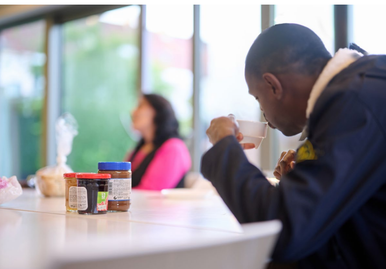
De sociaal-economische hervormingen hebben een directe impact op de leefomstandigheden van mensen

de Grondwet niet louter symbolisch. Er geldt voor deze rechten immers een verbod op achteruitgang (of standstill-verplichting): overheden mogen het beschermingsniveau van een recht niet gevoelig verminderen zonder redelijke rechtvaardiging op basis van een doel van algemeen belang. 8 Dit beginsel kan van toepassing zijn in diverse domeinen zoals gratis onderwijs, 9 het recht op een gezond leefmilieu of het beschermingsniveau van de rechtsstaat. 10