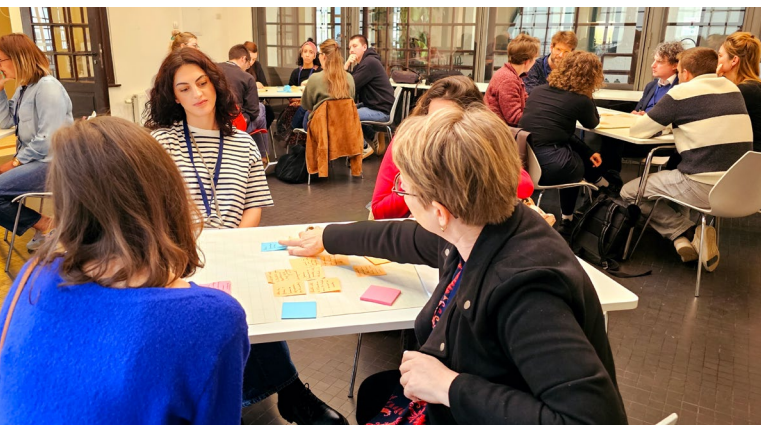
Une première journée de rencontre sur l'éducation aux droits humains

La rencontre s'est articulée autour d'une question centrale : comment ancrer les droits humains dans la vie quotidienne - à l'école, au travail, dans la famille et en ligne ? Les participants ont pris part à des ateliers animés par School for Rights, le Centre flamand de connaissances des droits de l'enfant (KeKi) et Unia. Ces ateliers ont permis de présenter des méthodes de travail, des outils pédagogiques existants et des stratégies concrètes pour intégrer les droits humains dans les pratiques professionnelles et organisationnelles.